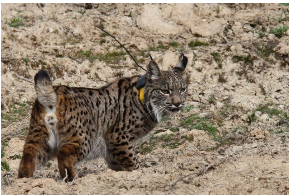
Libertação do macho Loro, no cercado de solta branda

Foi em 16 de dezembro de 2014 que o casal de lincos Jacarandá e Katmandú, provenientes, respetivamente, do centro de reprodução do ICNF, em Silves (CNRLI) e do centro de cria do OAPN, em Zarza de Granadilla, na Extremadura em Espanha, foram libertados no cercado de solta branda ou de aclimação, para o efeito instalado na Herdade das Romeiras, em São João dos Caldeireiros, no concelho de Mértola.